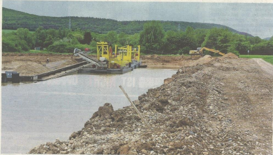
„Wasserflächen haben wir genug“, stellten Sander fest und sprachen sich gegen eine weitere Kiesausbeute in der Flur aus.

Er machte jedoch deutlich, dass die Gemeinde Sand, der Gemeinderat und er selbst schon mehrfach und unmissverständlich ihre ablehnende Haltung gegen eine weitere Kiesausbeute nordwestlich von Sand bekannt